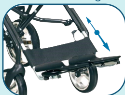
Réglage de la hauteur du repose-pieds