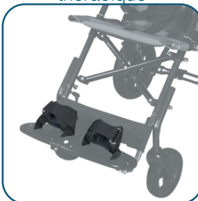
Fixation des pieds