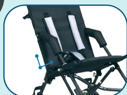
Réglage de l'inclinaison du dossier