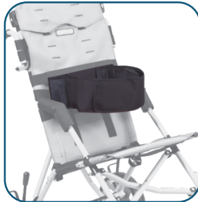
Ceinture d'immobilisation thoracique