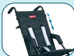
Réglage de la hauteur du dossier