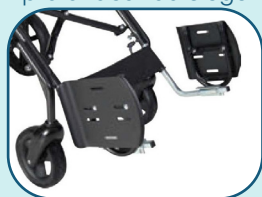
Repose-pieds pliable en 2 sections