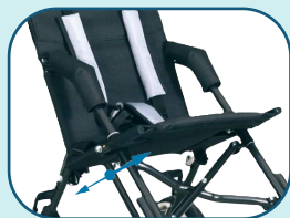
Réglage de la profondeur du siège