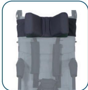
Coussin de tête avec latéraux