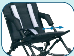
Réglage de la tension du siège