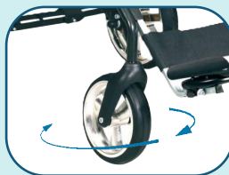
Roues avants pivotantes