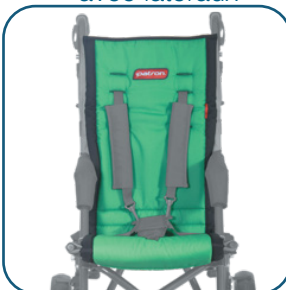
Housse de siège