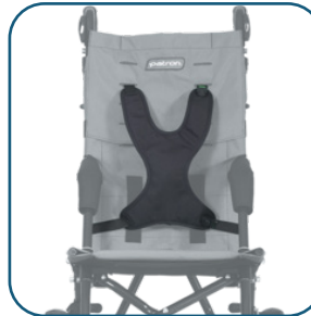
Harnais en "H"