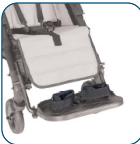
Fixation des pieds