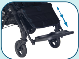
Réglage en hauteur du repose-pieds