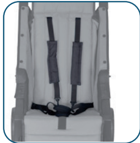
Ceinture 5 points