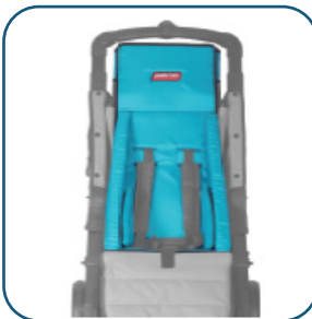
Coussin de croissance