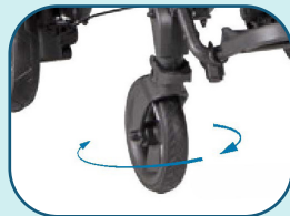
Roues avants pivotantes