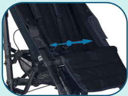
Réglage de la largeur