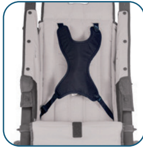
Harnais en "H"