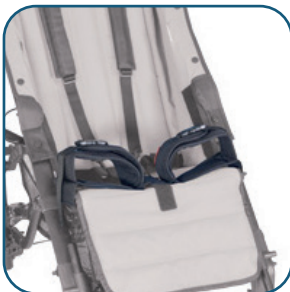
Support des cuisses