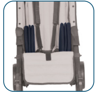
Coussinets de protection latérale