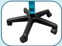
Base de nylon renforcé de fibre de verre