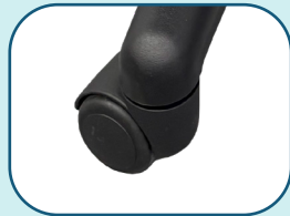
Roue double 2" en nylon