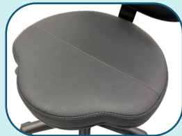
Assise profilée avec bande antidérapante