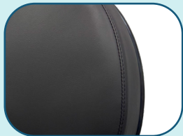
Revêtement de vinyle industriel