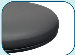
Revêtement de vinyle industriel