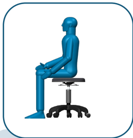
Assis à hauteur bureau