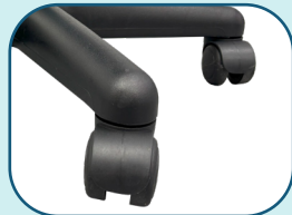
Roue double 2" en nylon