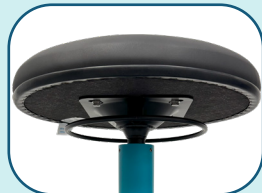
Anneau d'ajustement 360°