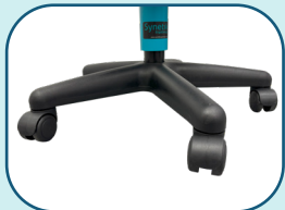
Base de nylon renforcé de fibre de verre