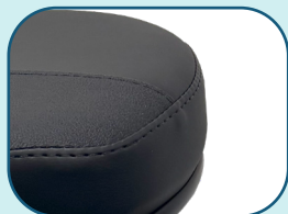
Revêtement de vinyle industriel