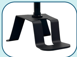
Base industrielle en acier avec semelles antidérapantes