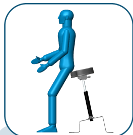
Assis-debout à hauteur comptoir