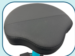
Assise profilée avec bande antidérapante